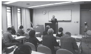
初回は57人が参加されました

昨年度に続き、江戸時代小城藩の参勤交代に関する史料を読みます。毎月第2土曜日14時から歴史資料館研修室で開催していますので、ご希望の方はご参加ください。