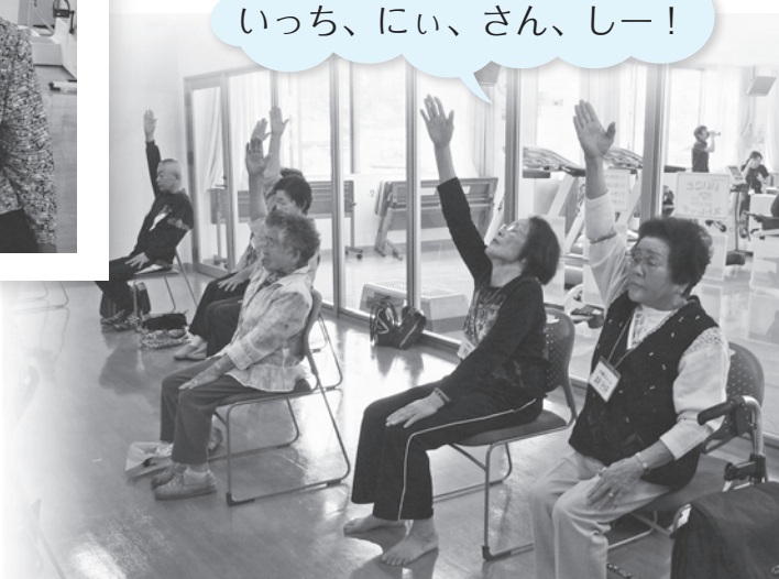
教室の風景（木曜日コース）