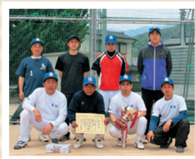
★1ブロック 優勝 高原ヤンキース