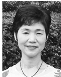
【プロフィール】 NPO法人「DV防止ながさき」代表