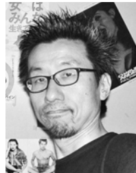
【プロフィール】 立命館大学大学院非常勤講師、神戸大学非常勤講師