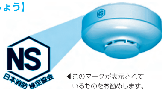
◀このマークが表示されているものをお勧めします。

消防職員のような服装や言動で訪問し、勧誘する業者がいます。市や消防署が火災警報器を売り歩くことはありません。