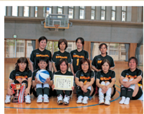
★Bブロック 優勝／東新町ファミリー