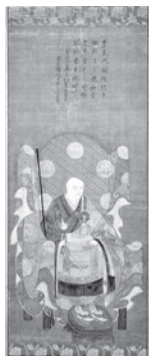
◀ 絹本着色閑室元佶画像