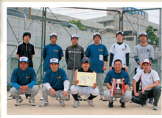
★2ブロック 優勝 西小路A