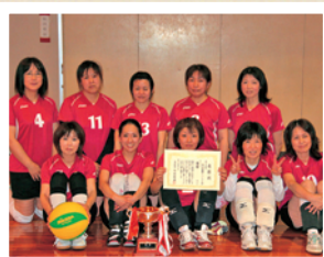
★Aブロック 優勝／畑田ファイターズ