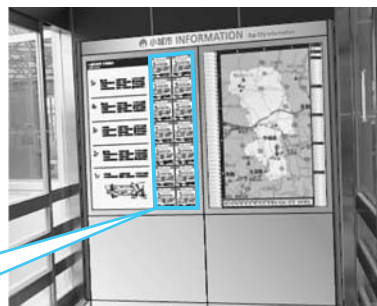
有料広告スペース