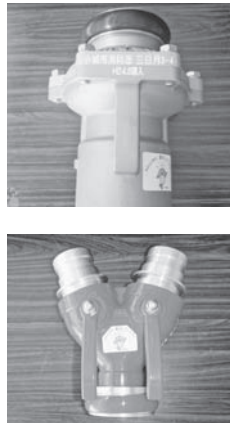
▶ダイレクトバルブ