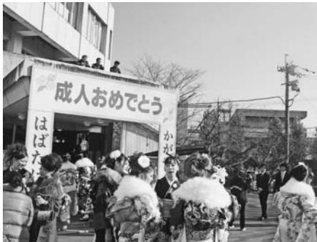
市のホームページから 成人式 で検索!