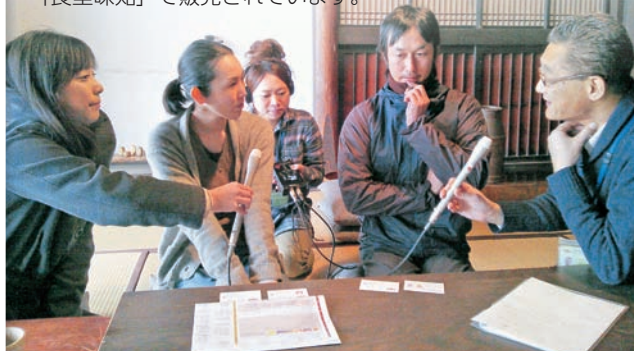
▲ラジオ「I♡OGI」の取材の様子。