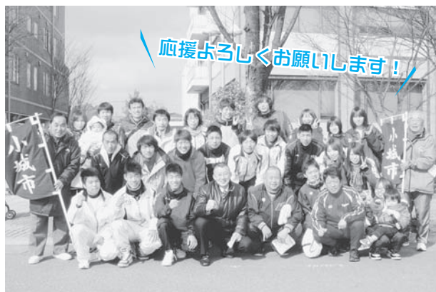
▲写真は昨年の様子