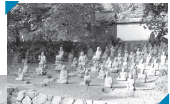
▲小城市重要文化財 五百羅漢 (星巖寺)