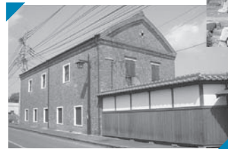
◀国登録有形文化財・ 22世紀に残す佐賀県遺産 牛津赤れんが館