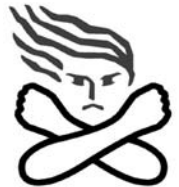
女性に対する暴力根絶のマーク

配偶者やパートナーからの身体的・経済的・性的暴力を指します。最近「デートDV」と言われる交際相手からの暴力も問題化しています。