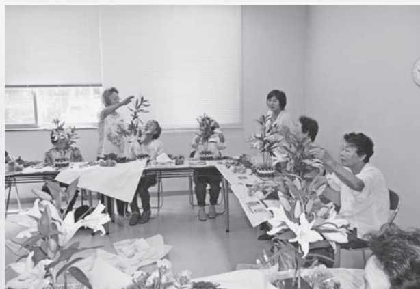
▲フラワーアレンジ