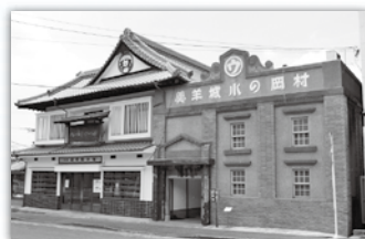
▲村岡総本舗羊養資料館