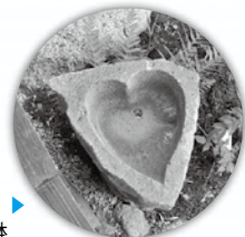
深川家「揚羽蝶」▶ ハート型の手水鉢