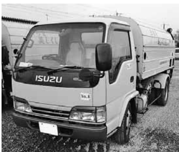
▲ 塵芥車 ▶