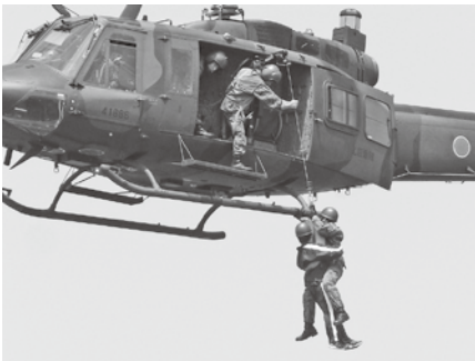
◀自衛隊による救助訓練

問 ● 防災対策課（西館2階）【担当】古庄・右近 ☎37・6119 ● 武雄河川事務所 ☎0954・23・7939