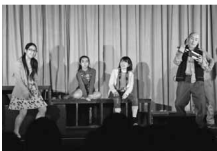
▲補助金活用例 小城市民劇団「おぎんと」