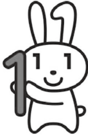
マイナンバーキャラクター 「マイナちゃん」