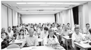
▲当日は約90人が参加されました。