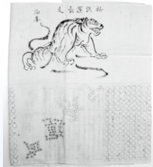
せんじんぼり 「千人針」▶

出征将兵の安泰を祈願して贈ったもの。「虎は千里走って千里を戻る」の言い伝えから虎図が描かれています。