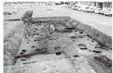
▲ハッ戸遺跡8区全景(北から)

ハッ戸遺跡 光勝寺 松土居 寺浦遺跡 などの出土遺物 と解説パネルを 展示します。