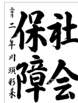
◆佐賀税務署長賞 かわづ あやな 川頭 彩菜 (三日月中2年)