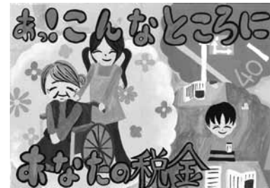
◆佐賀税務署 長賞 とくしま ゆい 徳島 由依 (晴田小6年)