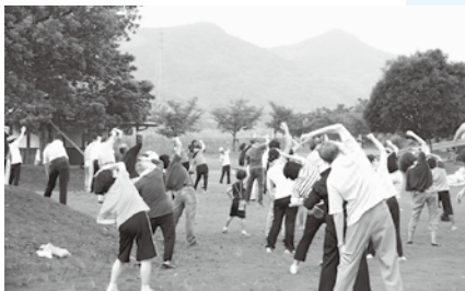
メイン会場の 牛津総合公園