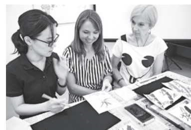
▲竹を描いた墨絵の授業

アッサロムアライクン！（ウズベク語で「こんにちは」） 今月は活動内容について紹介します。私がウズベキスタンで行っているボランティアは2つ。日本語教育と日本文化紹介講座です。いずれも対象はウズベキスタンの素直で元気すぎる青少年たちです。最近、講座参加者20人で、きな粉団子を作って大盛況でした。ウズベキスタンでの1番人気の日本食は、お好み焼きで逆に不人気は意外にも寿司です。酢飯が苦手なことと、内陸国であるウズベキスタンでは魚に抵抗があるそうです。また、墨絵の授業では、墨を使ったことのない生徒たちで教室の床が墨汁まみれになりながらも竹を描きました。