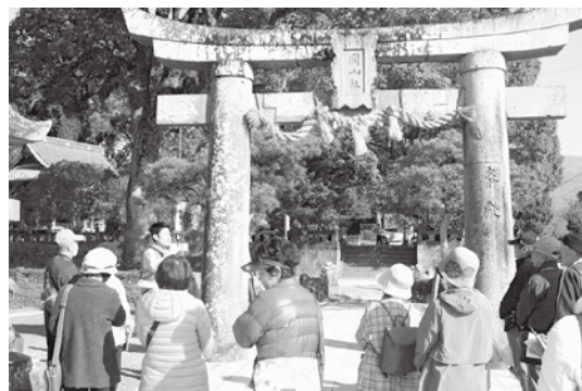
▲説明を受ける参加者(岡山神社)

3月11日(土)文化財ウォーキングを行いました。16人が小城駅・円通寺・村岡総本舗 羊羹資料館・小柳酒造など文化財を巡りました。