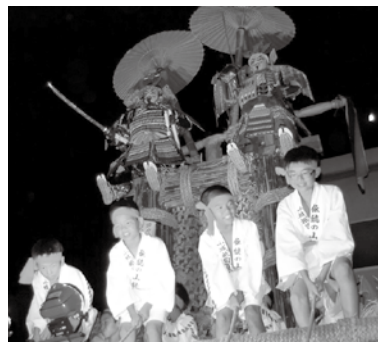
写真は700年祭 (平成28年7月) 時のもの

挽山行事も、今年で701年目を迎え、小城の伝統行事として脈々と受け継がれています。