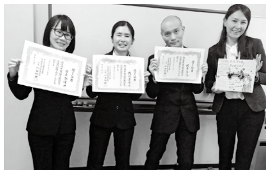
▲派遣前訓練の修了式

今月は「青年海外協力隊と語学」についてお話しします。協力隊をしていると「現地言葉はどうしているの？」とよく質問されます。私たち協力隊は派遣される前に70日間の派遣前訓練を行い、その期間に言語を習得します。週6日、朝から夕方までみっちり授業を受けます。もちろん中間テスト・最終テストもあり、合格できなければ隊員にはなれません。