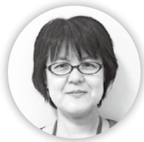
小城市役所 (高年齢障がい支援課) 楠