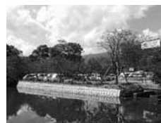
▲小城市公園駐車場整備 (まつや堀北側)

わいや商店街活性化、ひいては市内における経済の活性化が大いに期待されます。今こそ、公民学連携したまちづくりで、小城市のまちづくりを大きく飛躍させるチャンスです。みんなで「住みたいまち小城市づくり」に取り組みましょう。