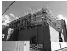
▲北棟 (事務室、講義室他)