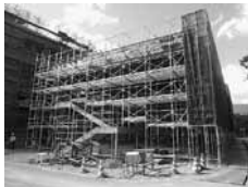
▲東棟 (カフェ、売店、多目的室他)