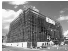
▲南棟 (図書館、実習室他)