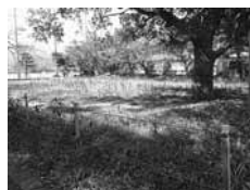
▲小城市公園駐車場整備 (旧ゲートボール場)