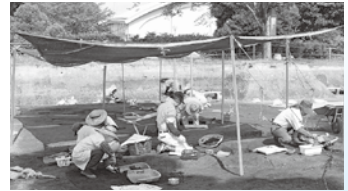
▲小城陣屋跡の発掘調査風景