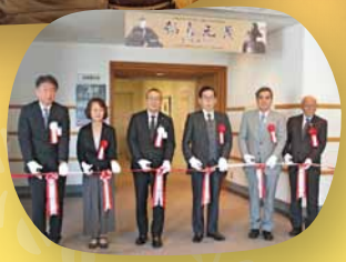
AR 鍋島元茂展 テープカット