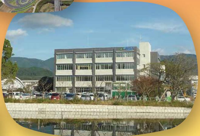
AR 西九州大学看護学部