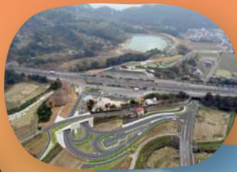
AR 小城スマートインターチェンジ