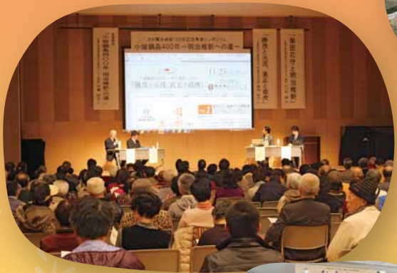
AR 小城鍋島400年記念シンポジウム