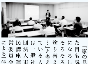
「家の見た目も気になる。そろそろ塗り替えを考えたい」と思っている一般市民は、市民講座運営委員会主催の「住まいの塗り替えセミナー」で正しい知識を身につけよう。