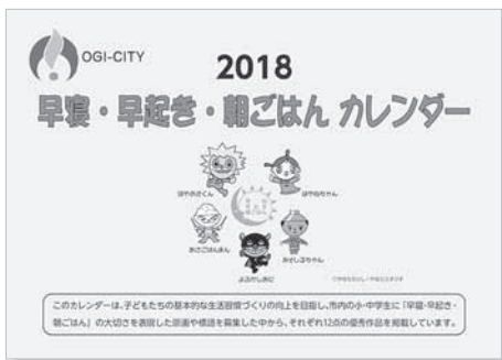
▲2018年版早寝・早起き・朝ごはんカレンダー

「早寝・早起き・朝ごはんカレンダー」は、子どもたちが健やかに成長していくために、調和のとれた食事、十分な睡眠など基本的な生活習慣が大切であることから、夏休みの期間中に市内の小・中学生に「早寝・早起き・朝ごはん」の大切