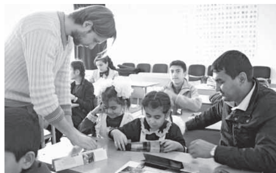
▲熱心に授業に取り組む子どもたち

今月はセンターで初めて行った「環境教育」のお話です。ウズでは一步外に出ると、お菓子の袋やたばこの吸殻、ペットボトル、ビニール袋が側溝に溜まっていたり、川の流れをせき止めるほどごみが落ちていたりします。大人が車の運転中にペットボトルを捨てたり、建物の中からたばこを捨てたりする光景もしばしば。また、ウズでは環境教育を行っている学校がとても少なく、私が住んでいるブハラの学校でもほとんどありません。そのようなウズの現状を少しでも変えることができればと、11月末に「ブハラのごみについて考えよう」という授業を開催。当日は10人の子どもたちが参加し、自分たちの町とごみの問題についてみんなで考えました。