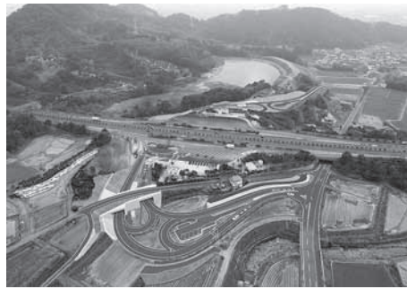
▲小城スマートIC完成予定写真