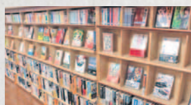
三日月館・小城館の本も借りることができます

有明海が近く、海苔の養殖などが盛んな芦刈町にある芦刈分室では、海苔や水産業などをテーマにした本を多く収集しています。 また、こども園が近いこともあり、親子で利用される人も多く、絵本や紙芝居が充実しています。 季節に合わせた特設コーナーを設置していますので、チェックしてみてください。 館内に緑があるのも、リラックフスできるのでおすすめですポイントです。