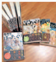
『居酒屋 ぼったくり』シリーズ 秋川 滝美／著 アルファポリス