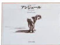
『アンジュール ーある犬の物語』 ガブリエル・パンサン／著 ブックローン出版

成年ということ、この本にしました。振り返ってこちらを見る犬の顔が印象的で、手に取った一冊です。文字も、色もなく鉛筆だけで描かれた「絵本」の原点と言え、思います。ページをめくるほどに心にせまるものがあり、胸にぐっときます。絵本に教えられます。読んでいただくので、ぜひ読んでいただきたいです。