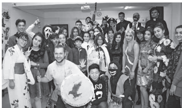
▲配属先での新年会

その代わりに、クリスマスの時期から新年を迎えるお祭りなどを行うため、日本よりも一足先にお正月を迎えたような感覚です。元旦を迎えた瞬間は、町の中心地で花火が上げられダンスを踊り、いかにも賑やかなことが大好きなウズ人らしいお正月を迎えます。