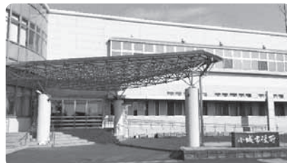
おたっしゃ本舗小城市