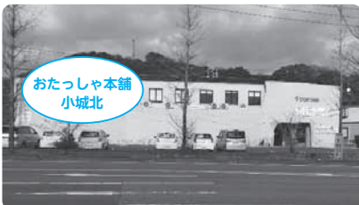
おたっしゃ本舗小城北