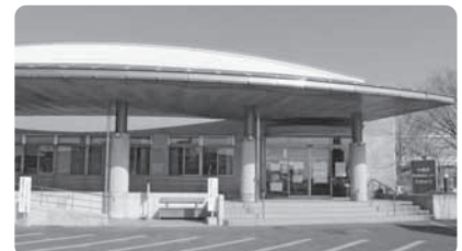
おたっしゃ本舗小城南