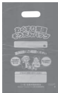
▲おくすり整理 そうだんバッグ