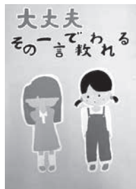
さかわら なぎさ 坂村 渚紗 (三日月中)