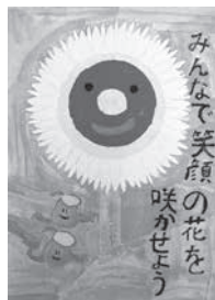
たなか うきょう 田中 胡杏 (小城中)