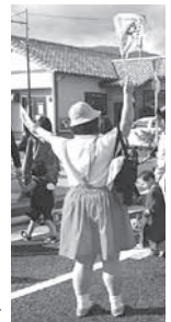
ちびまる子ちゃんに仮装▶