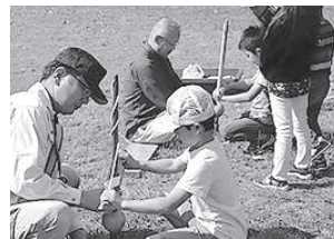
◀真剣な表情で火おこし体験する子どもたち

ります。各子育てサロンや小城市児童センターなどでクリスマスにちなんだ親子で参加できるイベントが満載です。また、12月23日(日・祝)に小城ルーテルこども園で開催される「幸せのクリスマスの灯」では、5,000本のキャンドルの温かい光が園庭を灯します。大切な人と一緒に出かけてみませんか。小城のまちが幸せの灯りにつつまれますように。