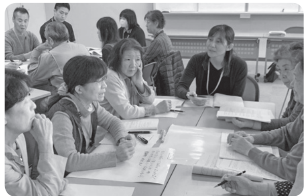
▲介護予防とまちづくり勉強会の様子