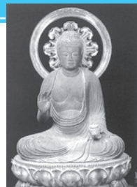
国指定重要文化財とその収蔵施設