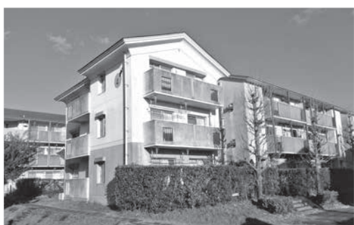
◀県営小城市団地(小城市町)