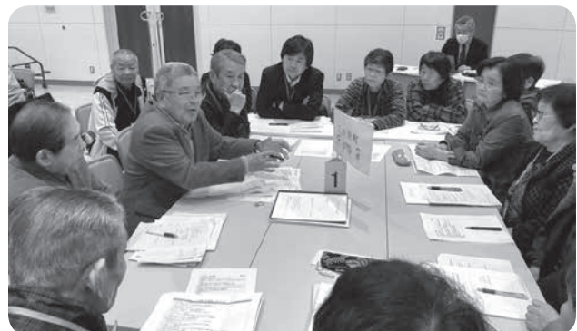
▲熱心に話し合う参加メンバー