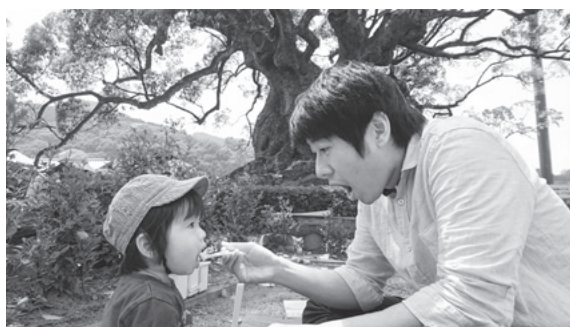
【平成30年度最優秀賞】「大きくなあれ」

※詳しくは、募集要項（各公民館、人権・同和対策室に設置、市ホームページに掲載）をご覧ください。