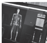
日常生活での体調不良のリスク指数

専用のカメラで体のゆがみとズレがミリ 単位で分かることで、今後の体調不良の リスク指数も知ることができるのです!