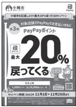
▲キャンペーン告知ポスター

支払日の翌日から起算して30日後に付与 ※PayPayポイント付与や支払い方法などについては一定の条件がありますので、詳細はPayPayのホームページでご確認ください。