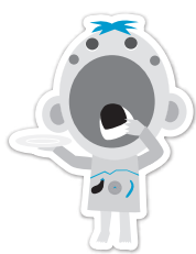
小城市食育キャラクター あーも！くん