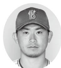
横浜DeNA ベイスターズ いまながしろうた 今永昇太選手

少年野球を始めるきっかけとして、合同体験会を実施します。現役のプロ野球選手がサポートしてくれます。