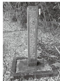
▲江藤新平生立ち之地