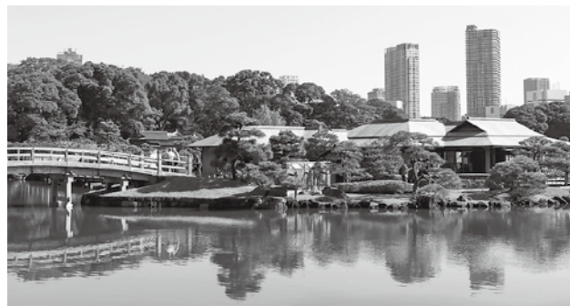
▲現在の浜離宮恩賜庭園

明治維新の後には皇室の離宮となり、名称も「浜離宮」と改められました。その後、昭和20年に東京都に下賜されて「浜離宮恩賜庭園」となり、現在も大名庭園の面影を残す名所として、多くの人を集めています。(続)