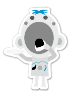
小城市食育キャラクター あーも！くん

1回の体操(約3分)で25kcalを消費できます。全身を伸ばしたり、足ぶみしてリズムをとったり、コミカルに腰を振る動きなどがあるため、子どもから高齢者まで楽しく体を動かすことができます。CD、DVDは、健康福祉課(小城市役所 西館1階)で無料でお渡ししています。ぜひ、ご活用ください。 詳細はこちらから▶