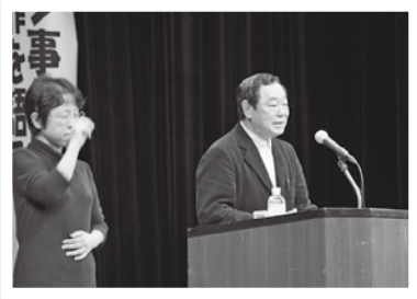
人権セミナー 河野義行氏の講演会 (12月15日)