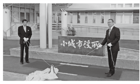
新庁舎除幕式 (1月4日)