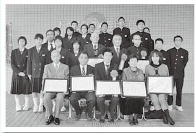
少年少女の声大会 (11月17日)