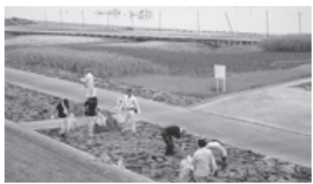
有明海クリーン作戦