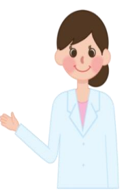
【小城市 特定健診・ヘルスサポート健診 実施医療機関一覧 (町別 50音順)】

個別健診、ヘルスサポート健診が受けられる県内の実施医療機関については、直接医療機関にお尋ねになるか、小城市役所健康増進課へ電話でお問い合わせください。(佐賀大学医学部付属病院、国立病院機構佐賀病院、佐賀県医療センター好生館、小池病院では受けられません。)