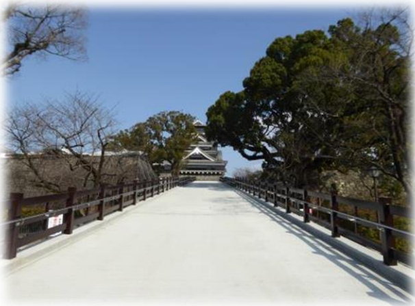
頼苑御門スロープの設置