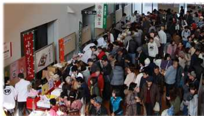
ようかん祭りの様子