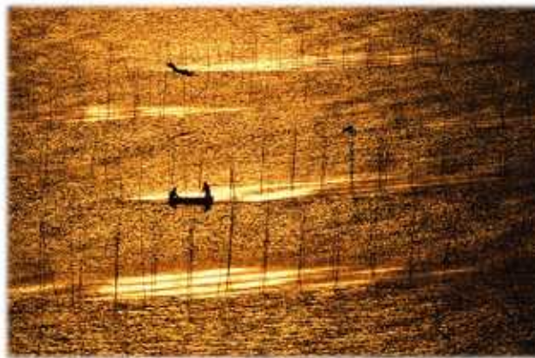
黄金色に染まる有明海