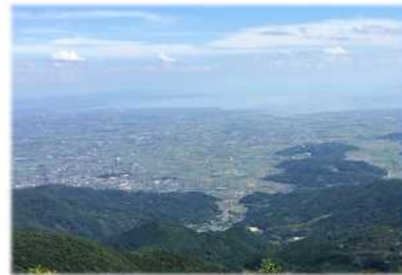
天山から小城市を望む