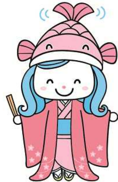
小城市キャラクター こい姫