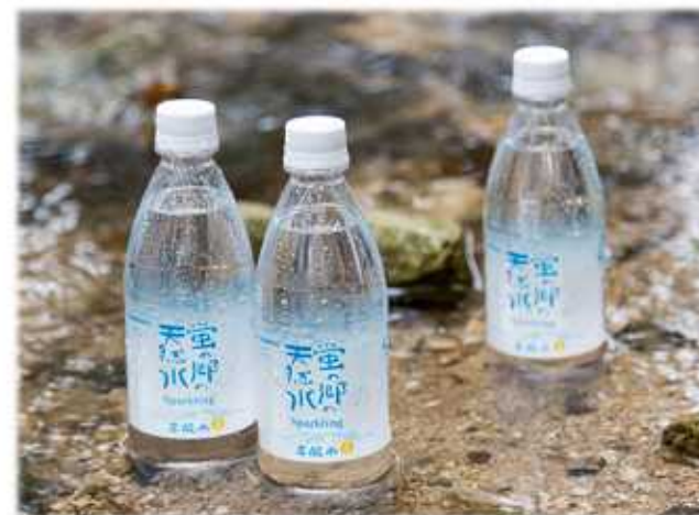
蛍の郷の天然水スパークリング

100年以上の歴史をもつ友桝飲料が生み出す、小城の名水を使用した「蛍の郷の天然水スパークリング」は、天山山系が磨き上げた天然水に炭酸のみを加えた炭酸水。日本人に適した硬度のナチュラルミネラルウォーターと炭酸の刺激が楽しめますし、強炭酸ですので割り材としても活用されています。他にも友桝飲料からは、「スワンサイダー」や「こどもびいる」など多くの人気商品が作り出されています。