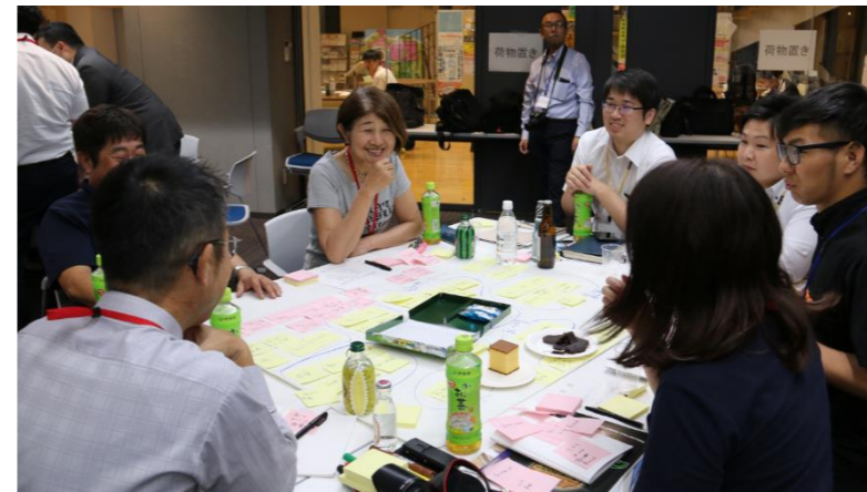
4つのグループに分かれ、みんなでアイデアを共有しました!